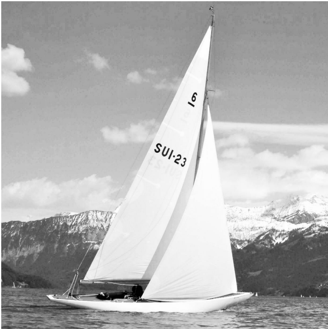
Bonite am Wind auf dem Thunersee

Ylliam IV, Bonite II, Atalante und Bonite... waren all die Namen dieser 6mR. Die Yacht wurde 1938 im Auftrag von M F. Firmenich bei Tore Holm in Gamleby (Schweden) gebaut mit dem Ziel, die „Bol d' Or“ Regatta zu gewinnen. Zeitgleich wurde bei Torre Holm die identische Schwesterjacht und Olympiasiegerin „Fågel blå“ auf Kiel gelegt. Die ersten Jahre segelte die Jacht auf dem „Lac Lemman“ und erreichte an Regatten nationale Erfolge. Im Jahre 1960 wurde die Rennjacht an die Segelschule „Thunersee“ verkauft und diente dort zusammen mit der 8mR – Jacht „Cupido“ als Trainingsboot. Seit dieser Zeit trägt nun die Jacht den neuen Namen „Bonite“. Bonite wurde auf dem Thunersee berühmt, nicht zuletzt, weil viele Schüler auf ihr den Segeleinstieg fanden.