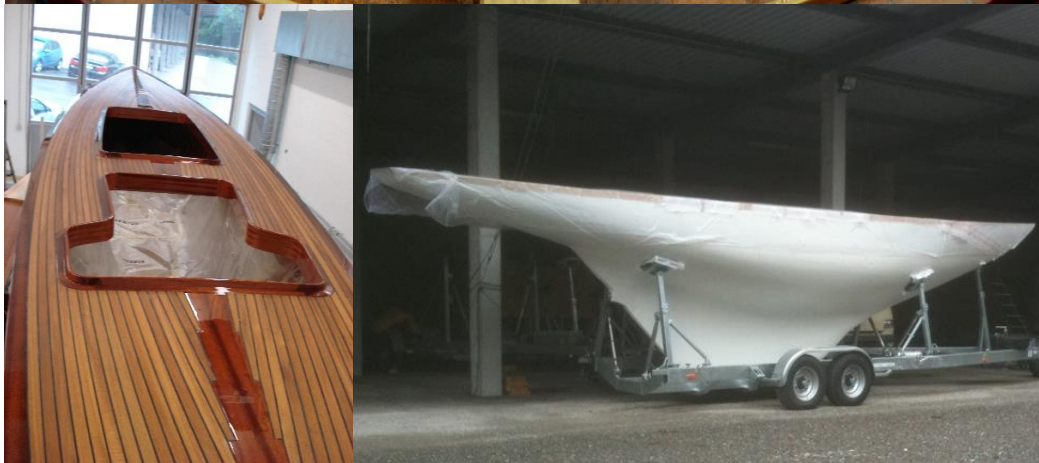
Komplettrestauration 2010, Archimedes Bootsbau - Wimmis